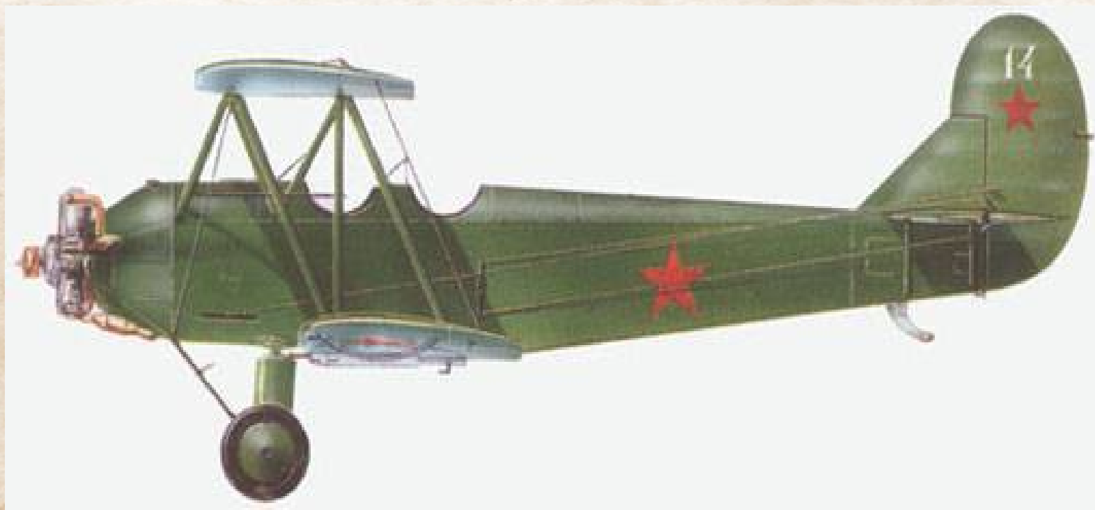
Самолет «По-2» (ночники).